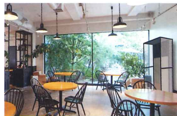
コンパクト設計で様々な空間に設置が可能です。