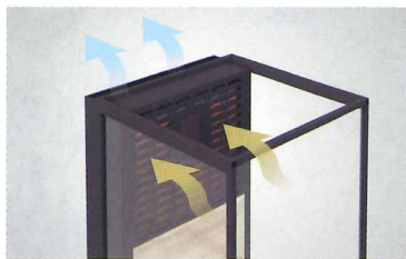
高レベルで吸気・脱臭・排気を行い、ブース内外の空気をクリーンに保ちます。