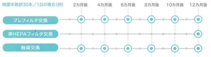
喫煙本数30本/1日の場合(例)